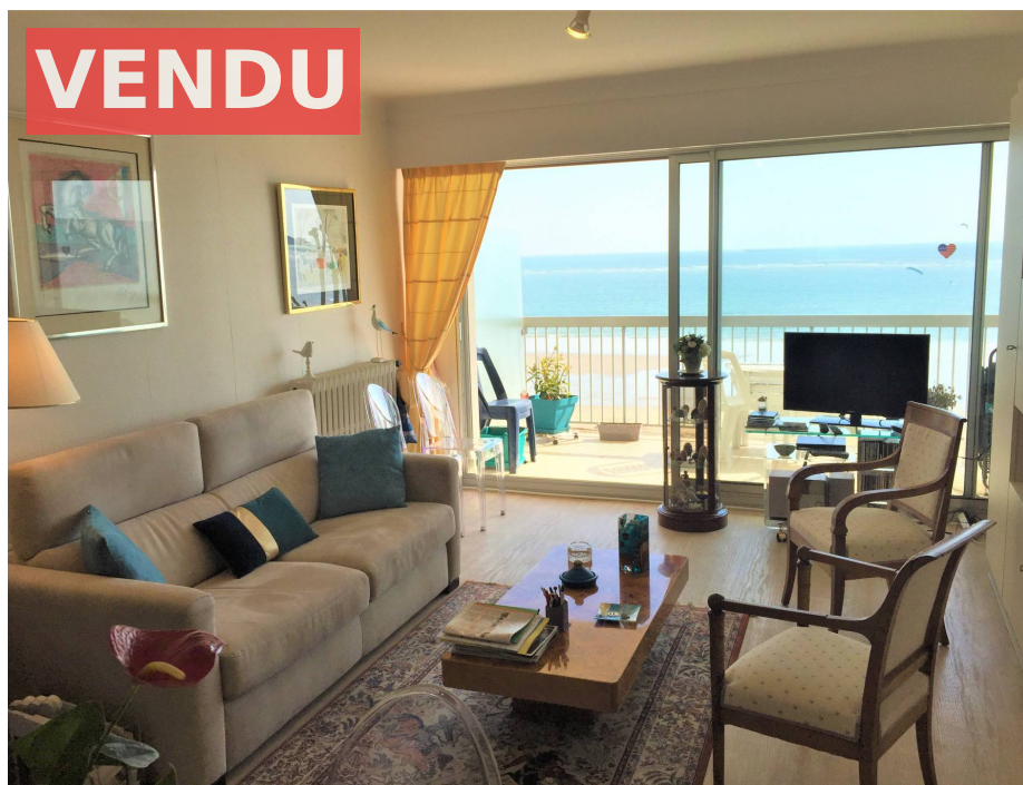
Viager occupé à LA BAULE face mer.

Honoraires : 36 960 € (5.5%) , Montant net vendeur : 250 000 € €